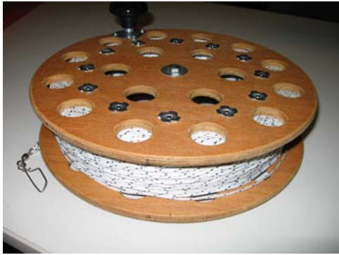
Een rol met 300meter 250kg